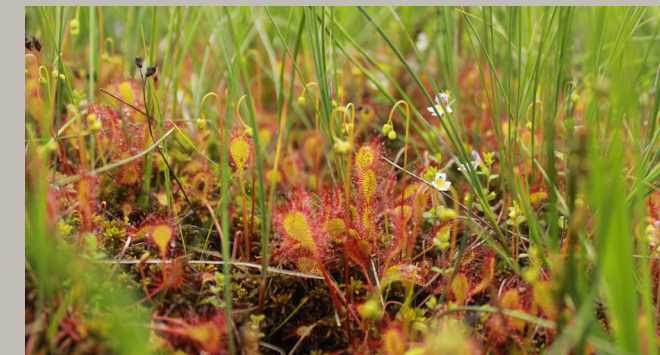
Sonnentau im Hochmoor