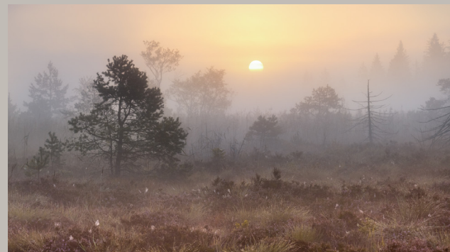
Neblicher Herbstmorgen bei Sonnenaufgang, Osterseengebiet Foto: Ulrike Eisenmann, AG Moore in Tutzing klimaneutral 2035

Vor und nach der Veranstaltung besteht die Möglichkeit, Bücher der Gemeindebücherei Tutzing zum Themenbereich Moore anzusehen ebenso wie Informationsmaterial zum Thema.